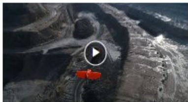
VIDEO – Rilievi ad alta precisione con WingtraOne PKK